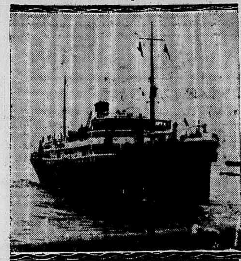
Uma das frotas que, sob o nome de Companhia Rio-Grandense de Navegação...

FROTAS NOVAS E MAIS FROTAS NOVAS, MENOS, PORÉM, PARA O LLOYD... — AGORA É A COMPANHIA RIOGRANDENSE DE NAVEGAÇÃO — OUTRAS NOTAS